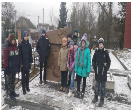
На экскурсии возле памятного знака